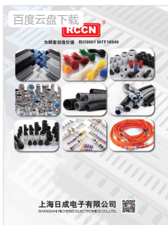
RCCN日成热销产品海报